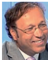
Ghaleb BENCHEIKH, Président de la Conférence mondiale des religions pour la Paix. Présentateur de l'émission "Islam" sur France 2