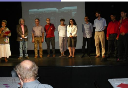
Ouverture de la soirée, en présence de Madame Depallens