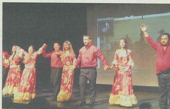
Avant de partager le repas avec leurs hôtes d'un soir, les Roms ont exposé leurs talents de danseurs, devant 140 personnes.